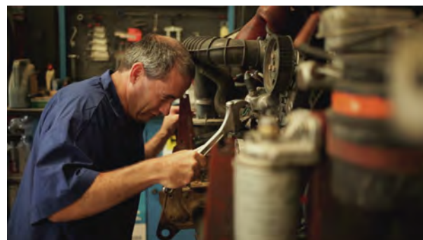
Fotograma del curtmetratge “Somnis” protagonitzat pels usuaris del Centre Ocupacional.

Gràcies els diners aconseguits a les actuacions i els productes venuts al museu “La Gabella”, enguany vam poder anar a Lleida a veure el musical “ MAMA MIA ”.