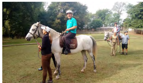
Sessió d'equinoteràpia al centre EL PAS a Taradell.

El fet de muntar augmenta la seguretat amb un mateix i l'aproxima a les condicions d'un genet convencional. És per això que millora la confiança, la capacitat de concentració i ajuda a superar tensions i inhibicions físiques i intel·lectuals.