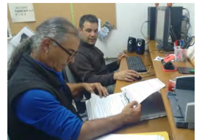
Sessió de formació a l'aula de l'entitat.

Es signa un nou conveni amb Patronat del Castell de Montsoriu per la neteja setmanal en diferents estances del Castell: Edifici de Serveis i Sala Noble. I per l'extracció de les males herbes de l'esplanada de recepció i el recorregut dels visitants. Des de 1995 ja s'està fent treballs de neteja i manteniment del castell de la zona forestal exterior.