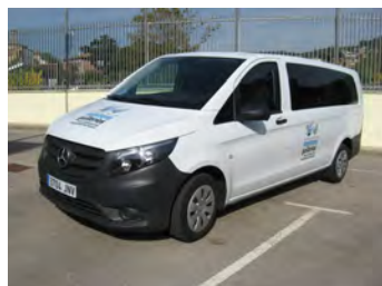
Furgoneta Mercedes Vito 114

El servei de transport substitueix una de les furgonetes Ford que portava molt quilometratge per la nova Mercedes Vito 114.